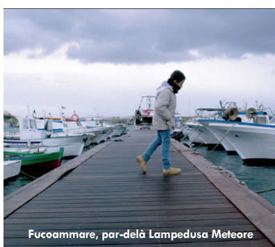
Fucoxammare, par-delà Lampedusa Meteore