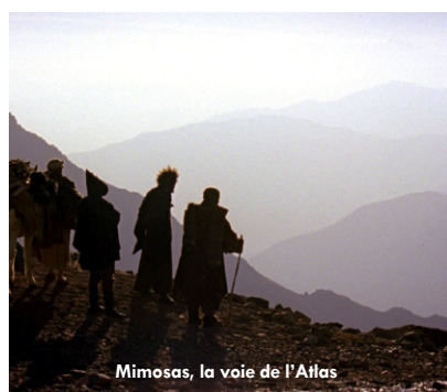
Mimosas, la voie de l'Atlas