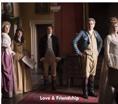
Love & Friendship