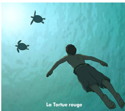
La Tortue rouge