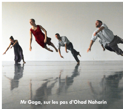
Mr Gaga, sur les pas d'Ohad Naharin