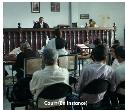
Court (En instance)