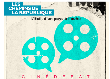
L'Exil, d'un pays à l'autre