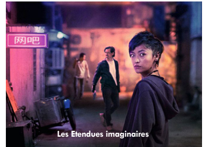
Les Etendues imaginaires