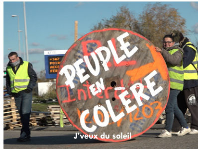
J'veux du soleil