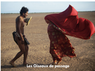
Les Oiseaux de passage