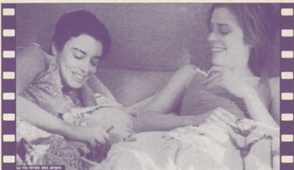
La vie rêvée des anges