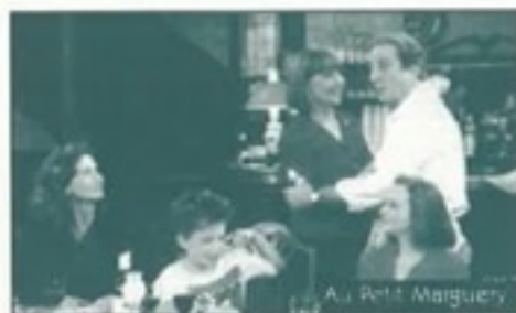
Au Petit Marguery

31 95 grand rue saint Michel 31400 TOULOUSE 61 53 50 53 : Répondeur vocal 61 93 46 46 : Pour tous renseignements