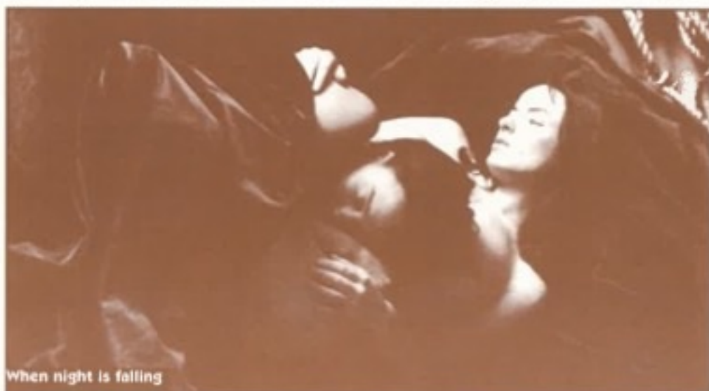
When night is falling

Un des bonheurs de ce printemps sera pour nous de recevoir Mario Martone qui accompagnera son film «Mort d'un mathématicien napolitain». Méditant sur les d'ér-